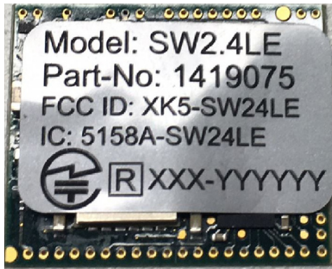
SW2.4LE wireless module