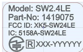
steute module label

FCC Regulatory information. OEM device should contain labelling that: Approved in accordance to FCC rules; transmitter module marked by FCC-ID »XK5-« label; manufactured by steute incorporated to OEM product. When it is not possible, user manual should include such information.