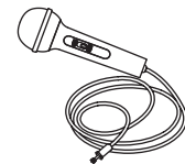
Microphone avec câble

Représentant aux É.-U. Nom de l'entreprise: The Singing Machine Company, Inc. Adresse : 6301 NW 5th Way, Suite 2900, Fort Lauderdale, FL 33309, USA Téléphone : 954 - 596 - 1000 Site internet : www.singingmachine.com